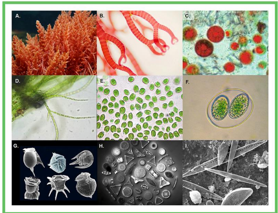
Figure 3. (A-C) Exemples d'algues rouges multicellulaires et unicellulaires. (D, E) Exemples d'algues vertes multicellulaires et unicellulaires. (F) Un glaucophyte, algue d'eau douce avec des plastes primaires. (G) Dinoflagellés vus au microscope électronique. (H, I) Diatomées vues au microscope électronique.

Ce processus est connu sous le nom d' endosymbiose d'ordre supérieur (Figure 2E). Lorsque les eucaryotes deviennent finalement des organites dans un autre eucaryote, ils sont connus sous le nom de plastes complexes dont la principale caractéristique est d'être entouré de plus de deux membranes (contrairement aux plastes primaires qui en ont deux). Mais le point le plus important à retenir est que l'endosymbiose d'ordre supérieur a permis à la photosynthèse de se propager dans le monde eucaryote chez des organismes vraiment intéressants, ceux dont tu ne penserais pas nécessairement qu'ils possèdent des plastes [3] (Figure 3).