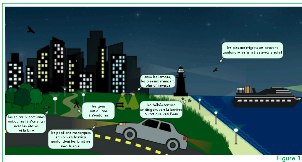
Figure 1. Scène nocturne montrant plusieurs types de lumières à l'origine de la pollution lumineuse. Remarque qu'il existe différentes couleurs de lumière. La pollution lumineuse se produit dans les zones urbaines (lueurs de la ville, lampadaires, phares des véhicules etc.) et dans les zones sauvages comme les forêts, les côtes et l'océan. Les animaux représentés ici peuvent tous être affectés par la pollution lumineuse.

LAMPES LED. Nouveau type d'éclairage qui utilise une diode électroluminescente (LED). Ces lampes nécessitent moins d'énergie que les ampoules plus anciennes et sont disponibles dans une variété de couleurs et de luminosités.